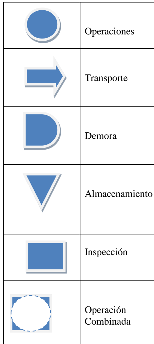
Tabla 2: "Simbología Para el Diagrama de Flujo del ANF"

Muestra de forma gráfica las actividades que realiza el activo en la entrega del servicio. Se debe considerar la simbología internacionalmente aceptada para indicar las operaciones a realizar, tal como lo muestra la Tabla N°2: