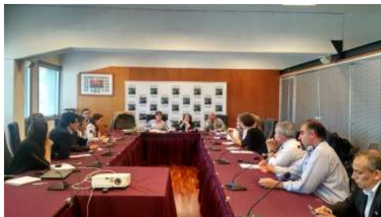
Martes 6 de Diciembre: Participación en Desayuno empresarial China Construction Bank: la clave para el incremento de la inversión y la productividad de la región, iniciativa que informa a la comunidad regional sobre la instalación en Chile de este banco, el segundo más importante de China y el quinto a nivel mundial, lo que viene a facilitar el comercio e inversión entre China y Chile.