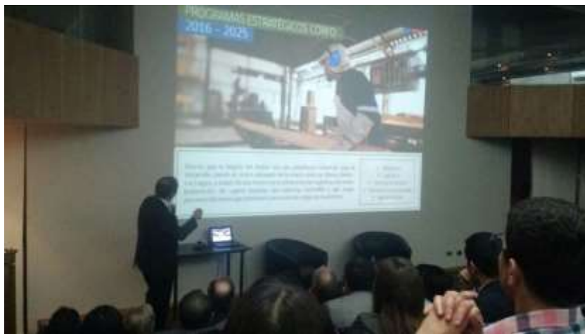
Jueves 1 de Diciembre: Se participa en reunión de representantes en Chile de la OCDE con la Corporación Desarrolla Biobío, Subdere Biobío y Comité de Desarrollo Productivo.