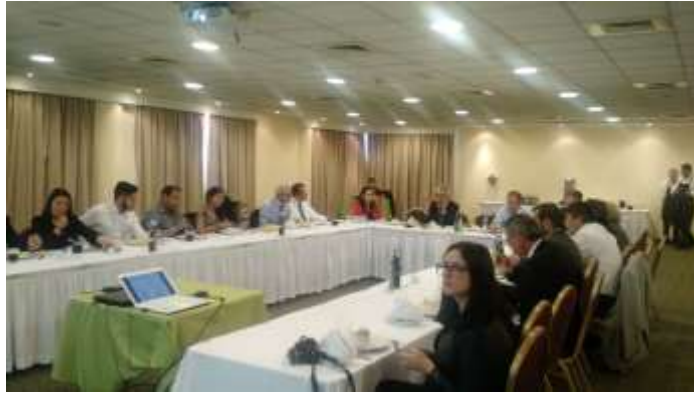
Martes 29 de Noviembre: Participación en seminario de Infraestructura de la Universidad de Desarrollo.