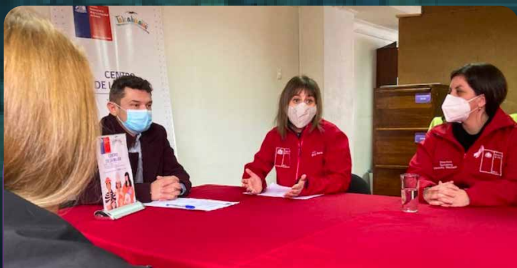
Seremi de la Mujer y la Equidad de Género