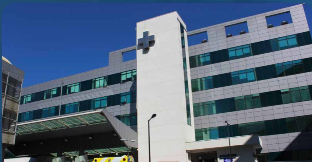
Consejo Regional del Biobío