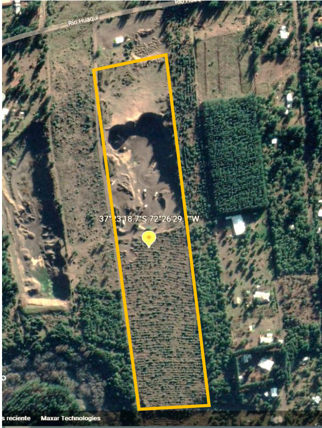
Área proyecto obtenida con Google earth