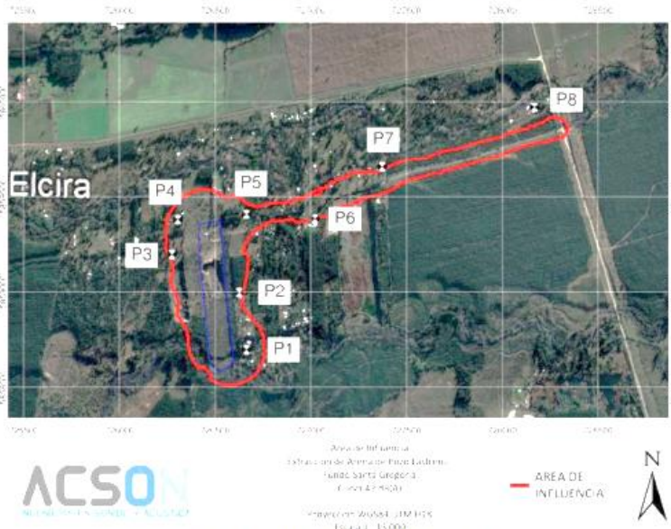
Ilustración 1. Área de influencia estudio de emisiones acústicas

Cabe señalar que, el área del proyecto no se relaciona de forma inmediata con coberturas compuestas exclusivamente con formaciones de vegetación nativa